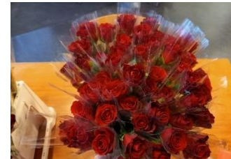
Valentijnsactie vanuit de GSA