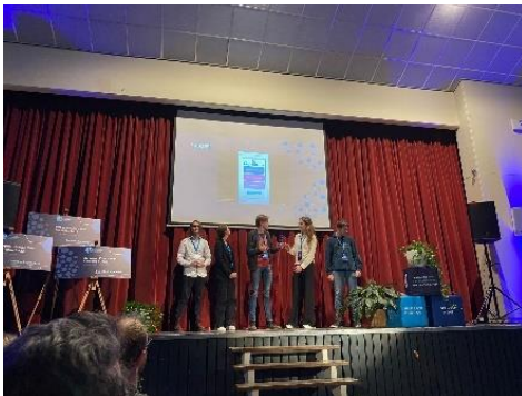
European Future Tech Challenge

De weken vliegen voorbij. De eerste helft van het schooljaar zit erop. Het winterportfolio van de leerlingen markeert het eerste gedeelte van dit schooljaar. De leerlingen nemen deze week hun winterportfolio mee naar huis, zodat de voorbereidingen getroffen kunnen worden voor het ontwikkelgesprek, dat na de carnavalsvakantie plaatsvindt. Het ontwikkelgesprek biedt de mogelijkheid om terug te kijken en te reflecteren op het eerste gedeelte van het schooljaar, maar vooral ook om vooruit te kijken en nieuwe doelen te stellen voor het zomerportfolio in juni-juli. Het terug- en vooruitblikken tijdens winter- en zomerportfolio markeert het ontwikkelproces van de leerlingen waar we samen met het team en ouders/verzorgers deel van uitmaken. We wensen jullie dan ook alvast betekenisvolle ontwikkelgesprekken toe. Maar nu eerst: carnavalsvakantie, alaaf!