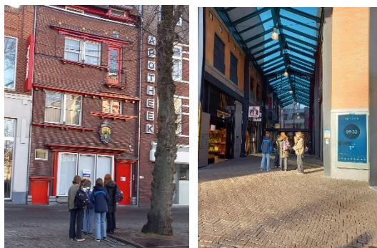
Periode architectuur in de stad (klas 8A)