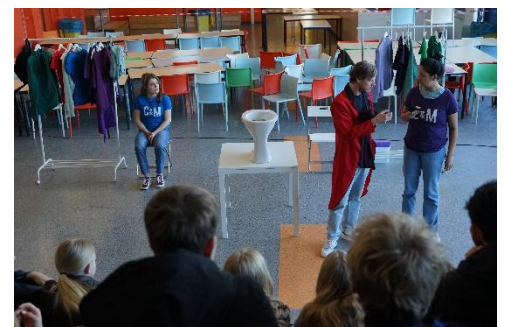
Voorstelling 'Later begint nu' van Signatuur onbekend (klassen 9)