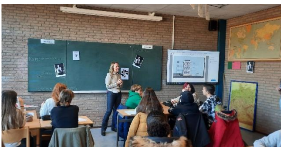
Periode architectuur in klas 8A