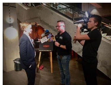
Voorstelling 'Wolfgang het wonderjong' In Parkstad Limburg Theaters