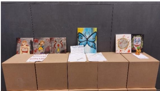
Periode Kunst & filosofie in klas 9A