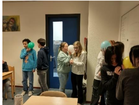
Periode hefboomen klas 7