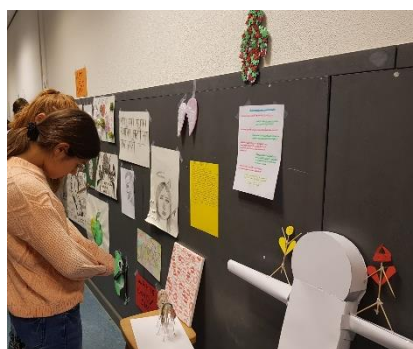
Afsluiting periode kunst & filosofie in klas 9B