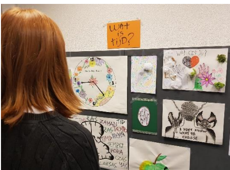
Wat is tijd?