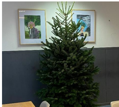
De nu nog kale kerstboom