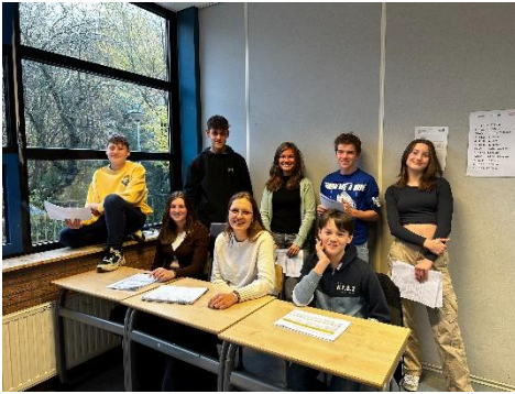
Het reviewteam van de interne audit

Nog twee weken en dan breekt de kerstvakantie aan en over tweeëntwintig dagen verwelkomen we het nieuwe jaar. De dagen worden steeds korter en de temperatuur daalt. Af en toe valt er zelfs al een beetje sneeuw. Steeds meer straten worden opgevrolijkt met kleurrijke kerstlampjes. Op onze school staat er sinds vanmiddag een kerstboom die de komende schooldagen wordt versierd door de leerlingen. De laatste twee weken vóór de kerstvakantie staat er nog een heleboel op het programma en daarover informeren we jullie graag in deze nieuwsbrief. De volgende nieuwsbrief versturen wij op vrijdag 23 december 2022.