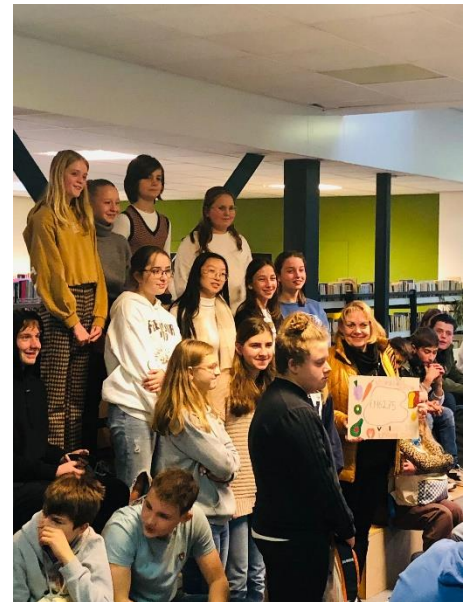
Bekendmaking van het sponsorloopbedrag