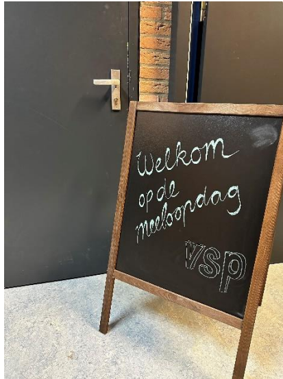
Afgelopen weken waren er meeloopdagen voor leerlingen van groep 8/klas 6.