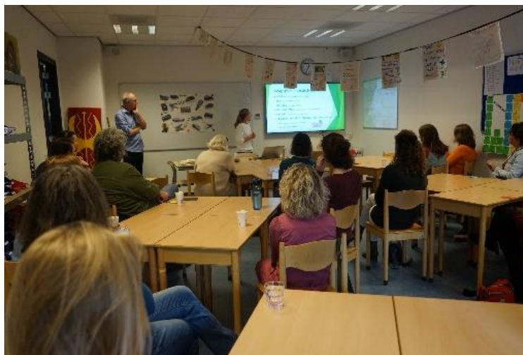
Een lezing over de leeftijdsfases tijdens de pedagogische zaterdag.