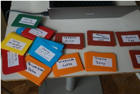
Voorbereiding pedagogische zaterdag.

De volgende nieuwsbrief versturen we op vrijdag 18 november 2022.