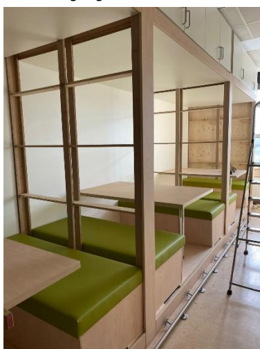
De stiltecabines in het leerpark zijn bijna klaar!