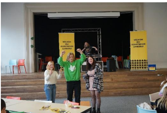
DJ van de Kunstbende in de aula tijdens de pauze.

Op donderdag 3 november 2022 was de Kunstbende op bezoek. Leerlingen zijn enthousiast gemaakt om mee te doen met de Kunstbende. Inschrijven kan hier .