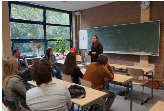
Periodeles van Petra