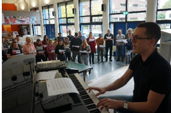
Samen zingen tijdens de pedagogische zaterdag.