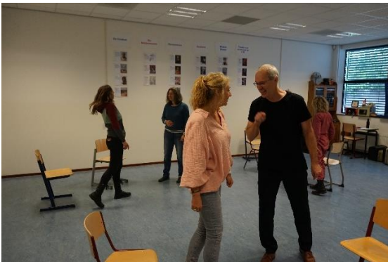
Dramales van Donny

Op zaterdag 15 oktober 2022 (van 11:00-15:00 uur) was de 'Pedagogische zaterdag' voor alle ouders/verzorgers van leerlingen van Vrijeschool Parkstad. Het was een leerzame dag.