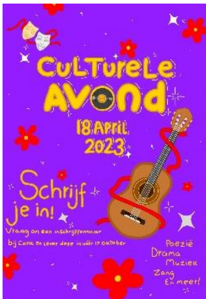
De voorbereiding van de culturele avond is in volle gang!