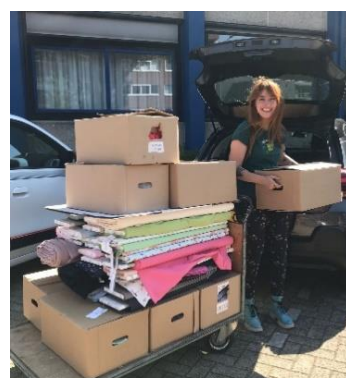
Donatie van ecologische stoffen door de moeder van Moon (klas 7)!