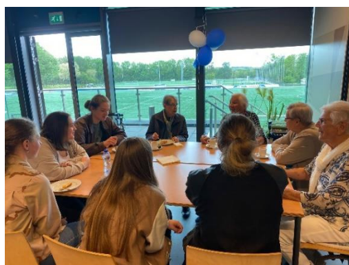
Project Lifestyle – leerlingen in gesprek met ouderen