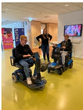
Project Lifestyle bij Ergotherapie Zuid