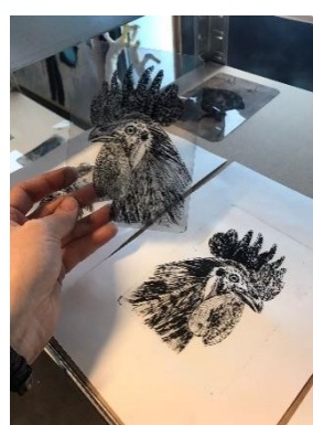
Druktechnieken klas 9