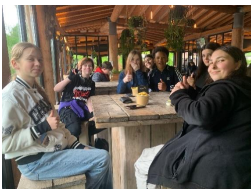
Uitwisseling met Europaschule in Gaia Zoo (klassen 7)