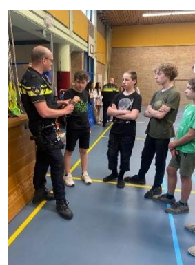
Politietraining klas 8