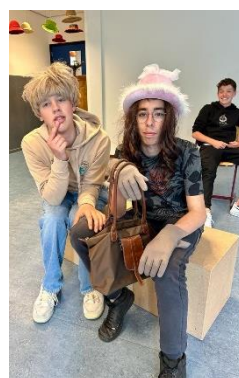
Hans en Grietje?