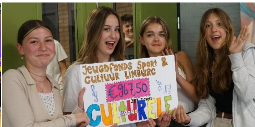
Cheque van €967,50 voor Fonds Sport & Cultuur Limburg via ticketverkoop Culturele avond