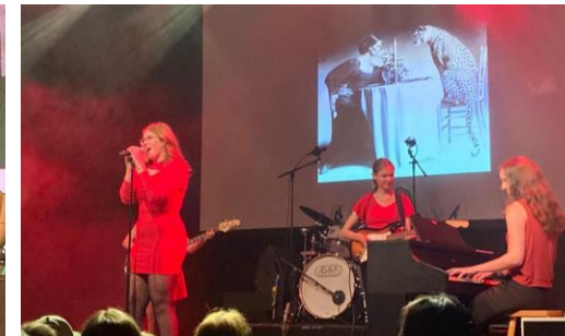
Mash-up eye of the tiger/rolling in the deep