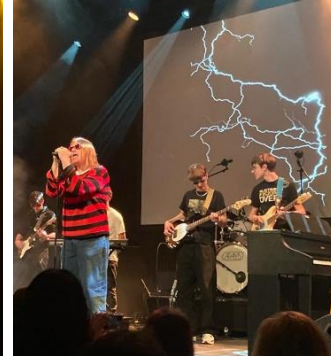
Blur song two