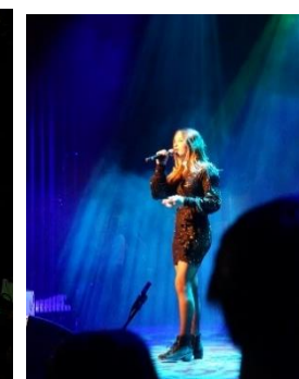
Fee en Rubin