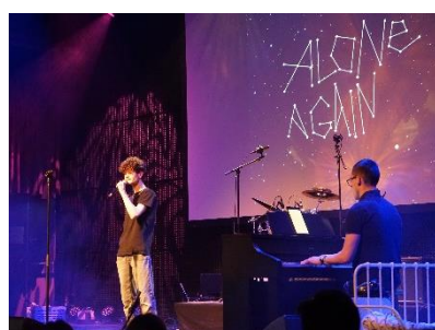
You let me walk alone