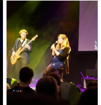
It's all about that base...