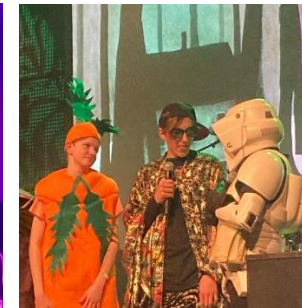
Het magische bos