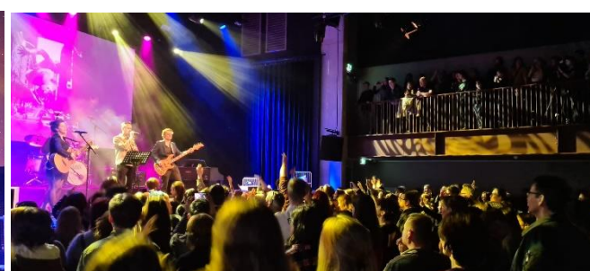
En we dansten automatisch...