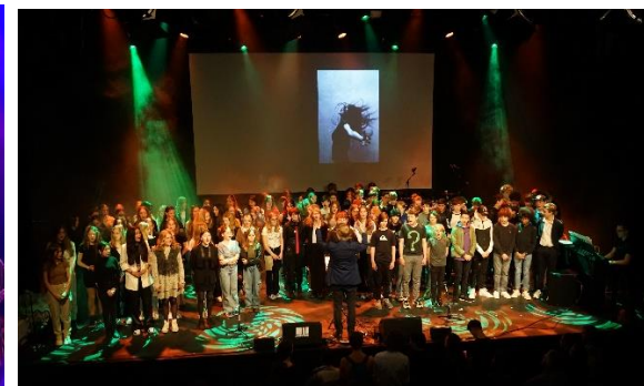
Koor klas 7 en 8