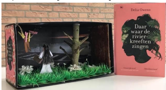
Periode verhalen klas 8B