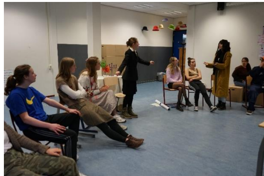
Repetitie voorstelling eindexamenleerlingen drama