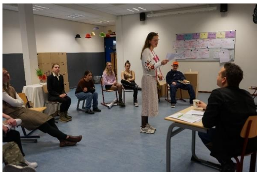
Repetitie voorstelling eindexamenleerlingen drama

De lente is vorige week begonnen en de dagen worden met een uur vooruit in de klok steeds lichter. De tijd vliegt en over een aantal weken staat de meivakantie alweer voor de deur. Voor de examenkandidaten betekent dit dat de laatste paar spannende weken voor het centraal schriftelijk eindexamen zijn aangebroken. Tegelijkertijd worden er ook al voorbereidingen getroffen voor de kennismakingsgesprekken met nieuwe leerlingen en ouders/verzorgers. De school draait op volle toeren en iedereen werkt keihard. Het is mooi om al die bedrijvigheid op onze school te zien. Hieronder een aantal foto's die deze bedrijvigheid weergeven.