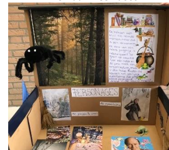
Periode verhalen klas 8B