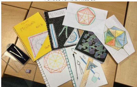
Periode meetkunde klas 7B