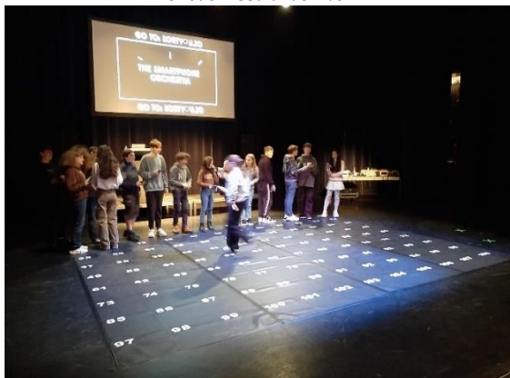
Bezoek voorstelling 'The social sorting experience'