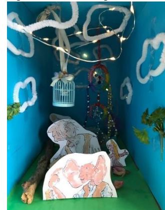
Verhaal in een doos