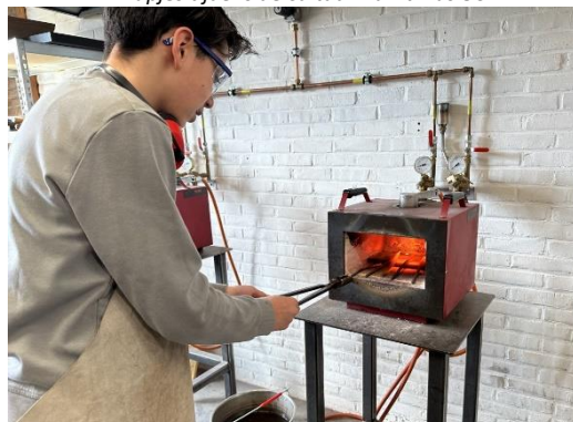
Smeden in klas 8A