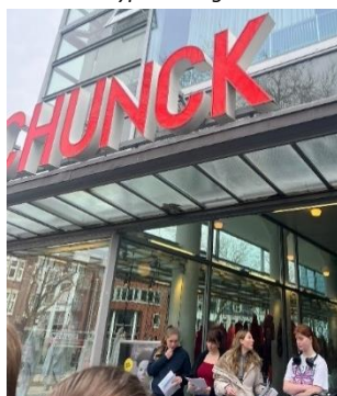
Periode CKV klas 10m