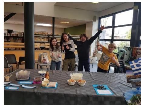
Cultuurmarkt klas 8C