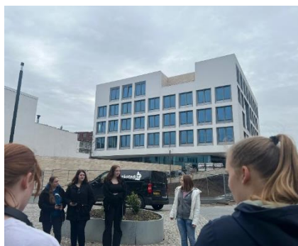
Periode CKV: typerende gebouwen in de stad