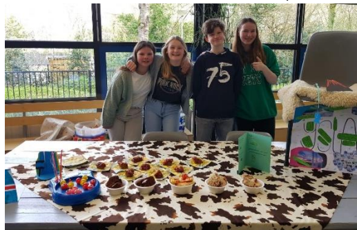
Hapjes tijdens de cultuurmarkt klas 8C